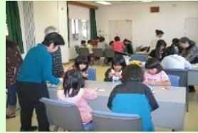
前回の折り紙教室の様子