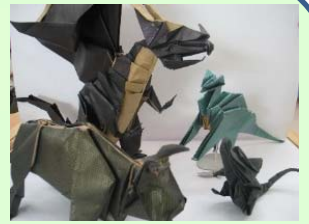
前回の作品展示の様子