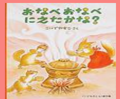
「まめのスープ」の元になった絵本↑